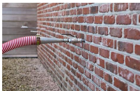
Vullen van de spouw via de vulopeningen

Langs deze vulopeningen blaas of spuit je het materiaal in de spouw geblazen met behulp van injectieerpistolen. Om te voorkomen dat vuil zich met isolatiemateriaal vermengt, boor je alle openingen voor het vullen van de spouw. Na het vullen van de spouw maak je ze terug dicht, de tijdelijk afgesloten stootvoegen maak je weer open.