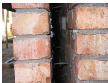
Niet-geïsoleerde spouwmuur: (vlnr) gevelsteen – spouw met spouwankers – dragend metselwerk, foto isolatie.net