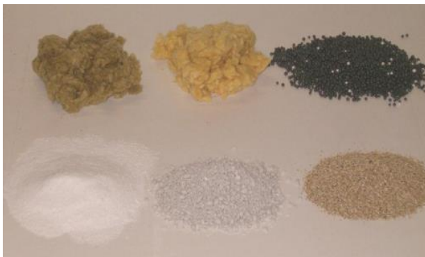
Rotswolvlokken, glaswolvlokken, geëxpandeerde PS- parels, perlietkorrels, silicaatschuimkorrels, vermiculietkorrels

Zo beoordeelt men de kunststofschuimen op vlak van vormvastheid of de mate waarin krimp optreedt. Specifiek voor PUR-schuim kijkt men de hoeveelheid open versus gesloten cellen na: hoe meer gesloten cellen, hoe kleiner de wateropname. Bij schuimen met gas, wordt dit blaasmiddel beoordeeld. Bij granulaten kijkt men naar de korrelgroottesamenstelling, de weerstand tegen leeglopen, het waterafstotend karakter en de bestandheid tegen verplettering.