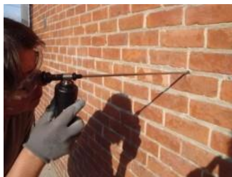
Endoscopisch onderzoek van de spouw

Een voorafgaande inspectie van de spouwmuur maakt een verplicht onderdeel uit van het takenpakket van een erkende aannemer. Dit moet gebeuren voor het ondertekenen van de overeenkomst. Vraag dit verslag zeker op, als het niet bij de offerte is gevoegd.