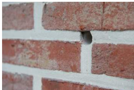
In het gevelmetselwerk worden gaten geboord op de kruising van lint- en stootvoegen

Deze aannemers zijn erkend als 'installateur bekwaam voor het uitvoeren van na-isolatie van spouwmuren met in-situ isolatieproducten'. Ze zijn verplicht om de werken uit te voeren in overeenstemming met de technische specificaties uit STS 71-1 (oa. het uitvoeren van een voorafgaande inspectie).