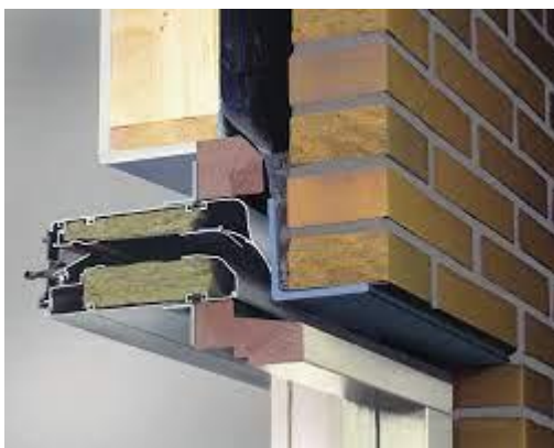
Akoestische ventilatieroosters: optimalisatie van de demping door de weglengte en de dikte van het geluidsabsorberend materiaal te verhogen (illustratie: BUVA)

Zolang de vereiste R_{Atr} -waarde van de beglazing niet hoger is dan 33 dB is een combinatie met een akoestisch rooster te overwegen. Bij strengere eisen is een mechanisch ventilatiesysteem, waarbij je geen roosters nodig hebt, een betere keuze.