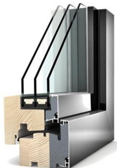
Thermisch verbeterd raamkader in hout-aluminium, illustratie Internorm

Vanuit milieuoogpunt (recycleerbaarheid) zijn profielen samengesteld uit verschillende materialen niet altijd een betere keuze.