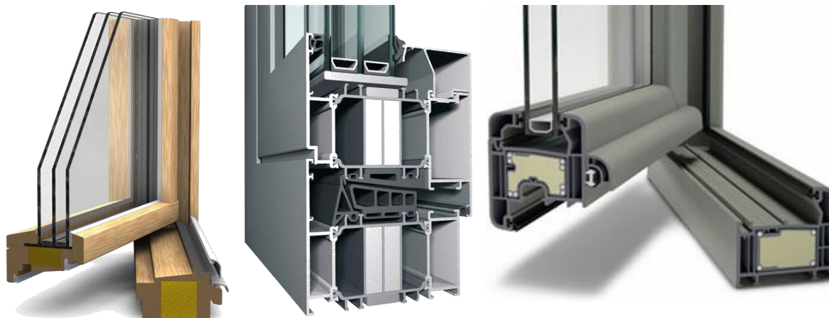
Thermisch verbeterd schrijnwerk in hout (links), aluminium (midden) en PVC, illustraties Van Hirthum, Reynaers aluminium, Deceuninck