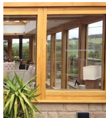
Buitenschrijnwerk in geacetyleerd hout

Houten ramen kun je op verschillende manieren afwerken (schilderen, beitsen ...). Wil je geen afbladderende laag aan de buitenkant, maak ze dan zo dampopen mogelijk, en zeker meer dampopen dan de binnenaafwerking. Vermijd producten met vluchtige organische stoffen.