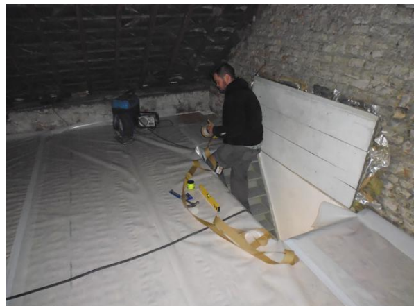
Plaatsen van een luchtschermben (PE-folie) op de bestaande zoldervloer

altijd zekerder om toch een luchtschermben te plaatsen.