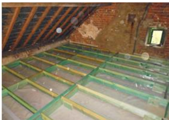
Plaatsen van een houten roostering op het luchtscherm, voor het aanbrengen van papievlakkenisolatie