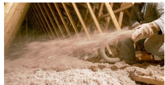
Papiervlokken open blazen bovenop de zoldervloer plaatsen: ontoegankelijke zolder