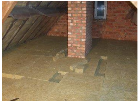
Drukvaste rotswolisolatie in twee lagen

Sommige firma's promoten het spuiten van polyurethaanschuim bovenop de vloerconstructie als de meest eenvoudige oplossing. Dit kan op voorwaarde dat het materiaal voldoende dichtheid heeft (minimum 40 kg/m 3 ) zodat de vloer beloopbaar blijft. De isolatiewaarde van gespoten PUR is echter heel wat minder goed dan van PUR-platen. Bovendien is het oppervlak oneffen en kan het isolatiemateriaal niet meer zomaar verwijderd worden achteraf. Een even eenvoudige oplossing is dan het blazen van papiervlokken rechtstreeks op de zoldervloer (zonder houten roostering). U kunt dan weliswaar niet meer op de zoldervloer lopen en de isolatie is ook niet afgeschermd van wind en knaagdieren en inspectie van het dak wordt moeilijk.