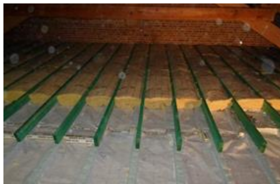
Luchtscherm, houten roostering en glaswolisolatie op de zoldervloer

Bij isoleren met halfharde of zachte isolatiematerialen, breng je eerst een houten structuur aan op de bestaande zoldervloer, waartussen u de isolatie kunt plaatsen. Voordeel is dat u oneffenheden van de ondergrond kunt wegwerken met de roostering, of kunt omzeilen door het onderbreken van het houtwerk ter hoogte van leidingen. Het is dan meestal eenvoudiger om in twee lagen te werken: de onderste structuur bestaande uit balken of blokken, vangt de oneffenheden op, de bovenste structuur (balken in de andere richting) kan doorlopend en vlak geplaatst worden en is geschikt om achteraf een loopvloer op aan te brengen. Zo blijven de koudebruggen ter hoogte van het hout beperkt. Maak gebruik van kepers, die door hun breedte niet gaan kantelen, of op hun kant geplaatste planken, die door middel van dwarsbalkjes ('stempeling') een vormvast geheel vormen. Wil je een goed beloopbare zolder, dan moet je voldoende aandacht besteden aan het goed uitlijnen, eventueel ondervullen, en bevestigen van de balken.