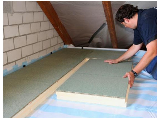
Drukvaste PIR-isolatieplaten met tand-en-groef en geïntegreerde spaanplaat

Werk de vloer aan de bovenzijde af met een loopvloer uit platen of planken. Dit heeft als voordeel dat de zolder begaanbaar blijft en nog steeds als (niet vorstvrije) bergruimte kan worden gebruikt. Een bijkomend voordeel is dat de isolatie hierdoor onbereikbaar wordt voor ongedierte. Kies bij voorkeur voor platen zonder toegevoegde formaldehyde. Wordt de zolder niet als bergruimte gebruikt, dan is een beplating niet echt nodig op voorwaarde dat de zolder toch bereikbaar blijft voor herstellingen of inspectie zonder de isolatie te beschadigen. Bij harde isolatieplaten volstaat het om de voegen en de aansluitingen tegen de muren winddicht af te kleven en eventueel enkel een loopvloer te plaatsen in het centrale deel van de zolder. Nadeel is dat de isolatie bereikbaar blijft voor knaagdieren. Halfharde of zachte isolatiematerialen zijn luchtopen, die werkt u altijd best af met platen of een dampopen folie (onderdakfolie) over het geheel van de isolatie. Bij daken zonder onderdak beperkt u hierdoor ook het risico van het nat worden van de isolatie door occasionele lekken en schermt u de isolatie af van invloed van de wind.