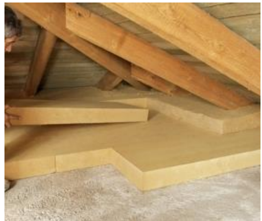
Drukvaste houtvezelisolatieplaten in twee