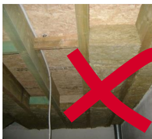
Vermijd leidingen tussen de isolatie

Verwijder, desgevallend, de bestaande plafondafwerking. Verwijder ook de leidingen die zich tussen de houten roostering bevinden. We willen immers het aantal doorboringen van de isolatie en het luchtscherm tot een minimum beperken. Na het aanbrengen van het luchtscherm (zie stap 3) kan je ze terugplaatsen onder het luchtscherm. Indien het niet mogelijk is om één of enkele leidingen te verwijderen, dan zal je na de doorvoeren luchtdicht moeten afwerken met een luchtdichtingsmanchet.