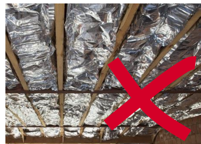
Zoldervloerisolatie met flensdekens: verkeerde plaatsing