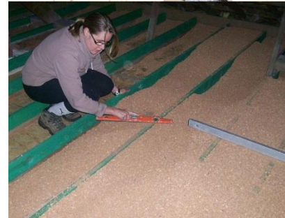
Zoldervloer isoleren met kurkkorrels