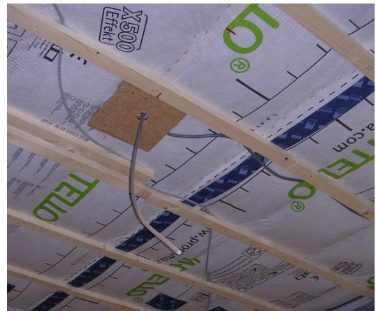
Luchtscherm bevestigen en afkleven, latten en kabels plaatsen tussen de latten

Een ononderbroken luchtscherm aan de warme zijde van de isolatie is noodzakelijk. Het luchtscherm niet je vast tegen de onderzijde van de houten draagstructuur. Gebruik zo groot mogelijke stroken scheurbestendige folie. Zorg ervoor dat de naden minstens 5 cm overlappen en dat de overlappingen zich ter hoogte van de draagstructuur bevinden, zo verminder je het risico op doorscheuren van het luchtscherm. Kleef de overlappingen af met geschikte kleefband. Zet het luchtscherm bijkomend vast met latten, (bv. panlatten van 24 x 32 mm) dwars op de draagstructuur. Tussen de latten kan je leidingen plaatsen. De exacte afstand van de latten kies je best in overleg met de uitvoerder van de afwerking.