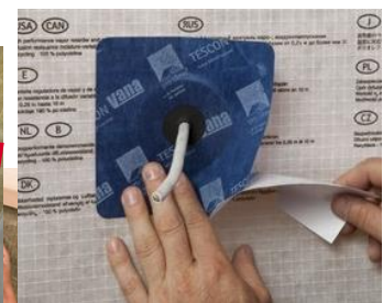
Leidingdoorvoeren afwerken met luchtdichtingsmanchet