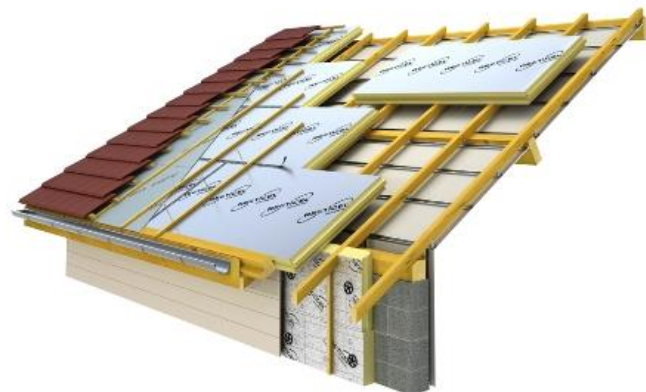
Koudebrugvrije opbouw

Bij een sarking-systeem kunnen koudebruggen eenvoudiger vermeden worden. De aansluiting van de muurisolatie met de dakisolatie verloopt een stuk eenvoudiger en bij een sarkingdak met doorlopende isolatieplaten wordt de isolatieschil ook niet onderbroken door houten kepers. Bij de sandwichpanelen met ingewerkte spanten geldt dit laatste voordeel niet.