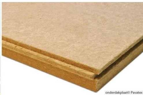
Houtwol sarkingplaten en onderdakplaten