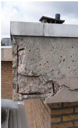
Schade aan betonnen dakrand