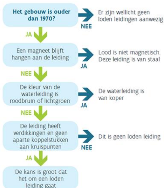
Beslissingsboom loden leidingen (illustratie: Vlaams Instituut Gezond Leven),

In woningen ouder dan 1970 kunnen nog loden drinkwaterleidingen aanwezig zijn. Je vervangt ze best zo snel mogelijk. Bij een loden aansluiting voor de watermeter staat het waterbedrijf hiervoor in. De vervanging van loden leidingen in de binneninstallatie (na de watermeter) is de verantwoordelijkheid van de eigenaar. Bij verhuur van een woning zijn loden waterleidingen niet toegestaan, ze moeten verplicht vervangen worden. Meer informatie vind je www.vmm.be/waterloket/loden-leidingen