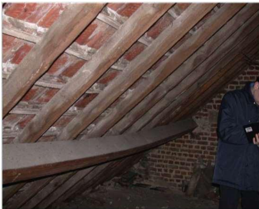
Doorbuigende gording van een hellend dak

Zodra je twijfels hebt bij de stabiliteit van een gebouw, bijvoorbeeld bij de aanwezigheid van barsten, doorhangende balken, verzakkingen... doe je best beroep op een architect of (stabiliteits)ingenieur om de ernst van de situatie in te schatten en mogelijke remediëringen voor te stellen. De oorzaken van de schade kunnen heel divers zijn: onstabiele ondergrond, ondergedimensioneerde opbouwen, overbelasting, gebruik van minderwaardige materialen, aanwezigheid van vocht... Op een geschikte organische voedingsbodem (hout, papier, bepleistering...) en bij een voldoende hoog vochtgehalte kunnen zwammen, schimmels en insecten zich ontwikkelen en de materialen aantasten.